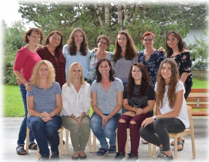
Das Kindergartenteam Meiningen

Wir freuen uns auf eine gute Zusammenarbeit und wünschen Ihnen und Ihrem Kind ein wunderschönes, ereignisreiches Kindergartenjahr!